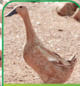
Itik Mojosari Betina