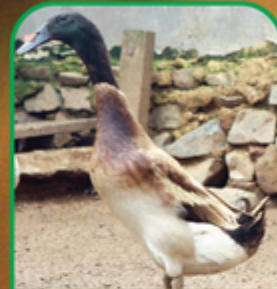
Itik Mojosari Jantan