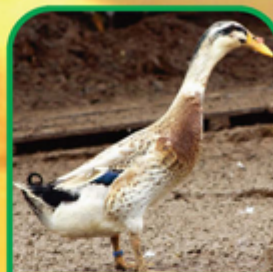
Itik Alabio Jantan